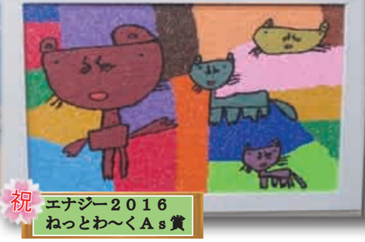
祝 エナジー2016 ねっとわ〜くAs賞