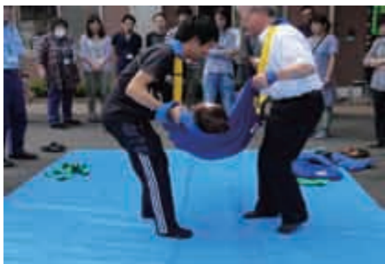
障害者支援施設希望の郷での防災訓練の様子