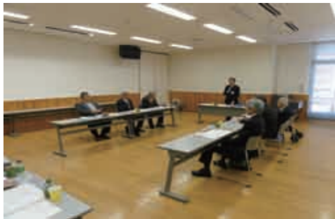
第120回理事会（障がい者交流センター）